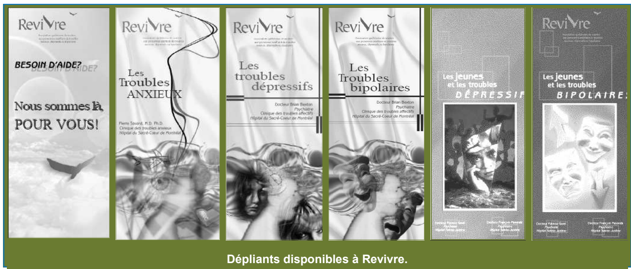
Dépliants disponibles à Revivre.